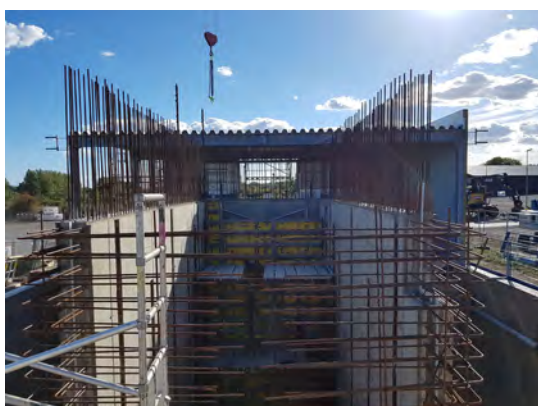
Tillbyggnaden är i full gång på Stengårdens avloppsreningsverk.