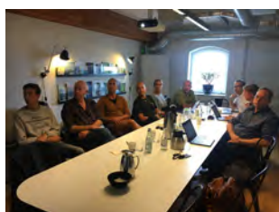
Fältexperimenten avslutades med en gemensam workshop för att analysera resultaten.