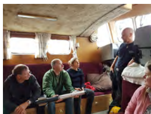
Förberedelser ombord inför första testkörningen.