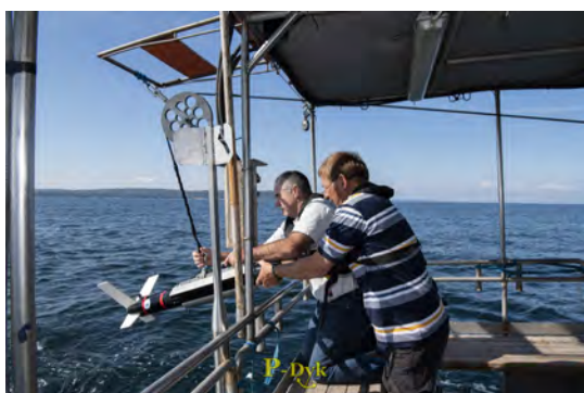
Sonaren på väg ner i vattnet.